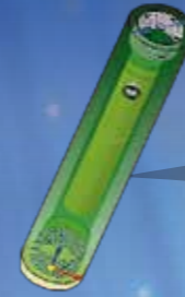
Filtro coalescente Carga y Descarga Alto Flujo