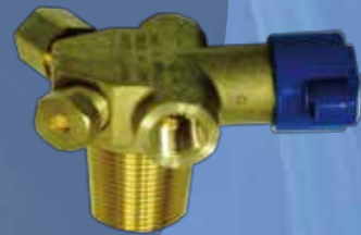
Válvulas de cilindros