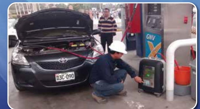
Calibraciones de Surtidores