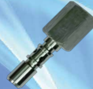
Picos de carga