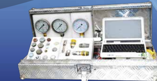
Calibraciones de Válvulas de alivio. Con registrador digitalizando la información