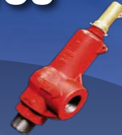
Válvulas de alivio Taylor, Tyco, Mercer Kits permanentes