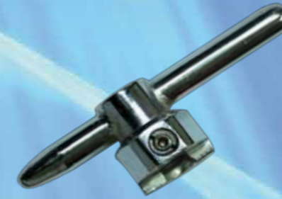
Manivela de válvulas de tres vías