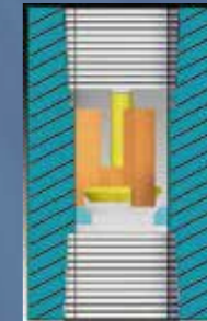
Exceso de flujo