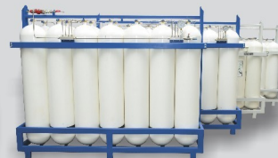
Almacenamientos para EDS