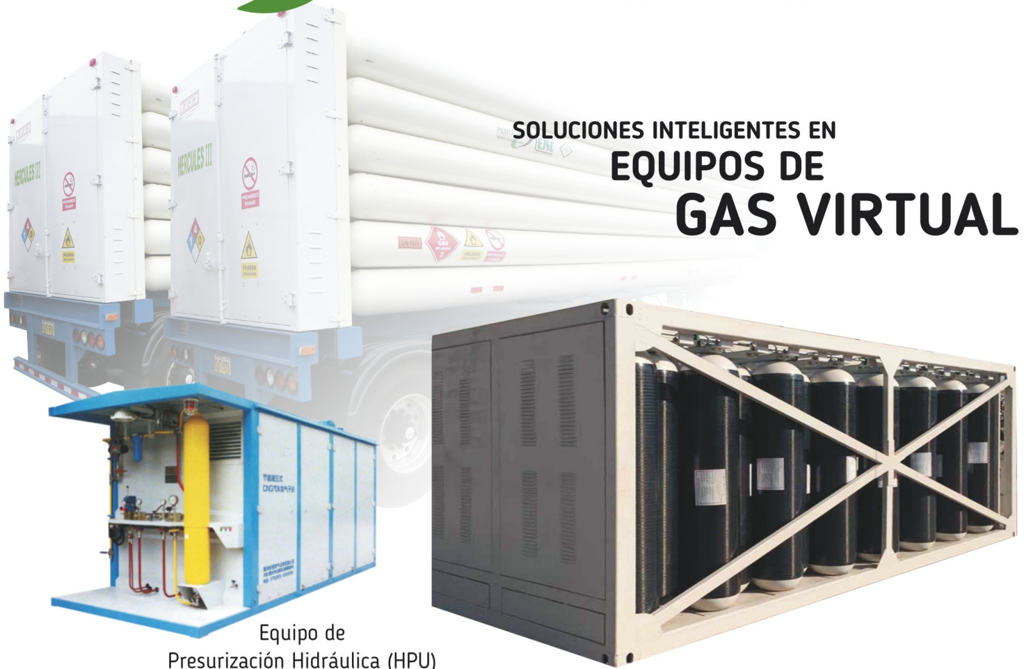
Equipo de Presurización Hidráulica (HPU)

25 años dedicados a la línea de gases comprimidos, 10 años innovando en el mercado de GNV