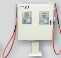
Fill Post de Flujo total